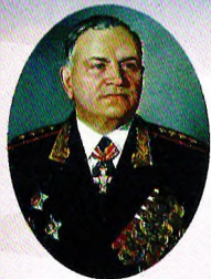
Генерал армии А.В. Хрулёв

Военная орденов Кутузова и Ленина академия материально-технического обеспечения имени генерала армии А.В. Хрулёва Министерства обороны Российской Федерации прошла большой и славный путь своего становления и развития. Она ведет свою историю с 31 марта 1900 года, когда в столице России – Петербурге впервые в мире было создано специальное военно-учебное заведение тыла – Интендантский Курс для подготовки офицеров и чиновников интендантского ведомства.